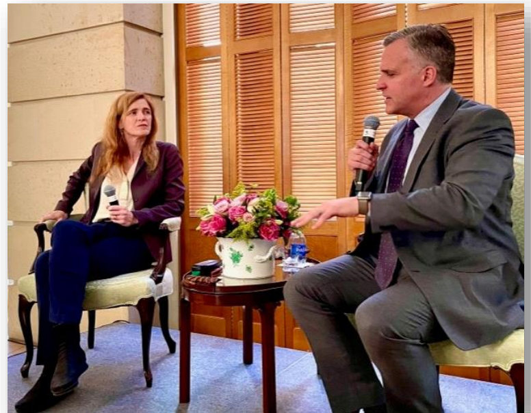
Ci-dessus: L'Administratrice Samantha Power avec l'ancien Chef du Protocole Rufus Gifford.

L'Administratrice a rappelé à cette occasion les nombreuses priorités du gouvernement Biden/Harris concernant les activités de l'Agence.