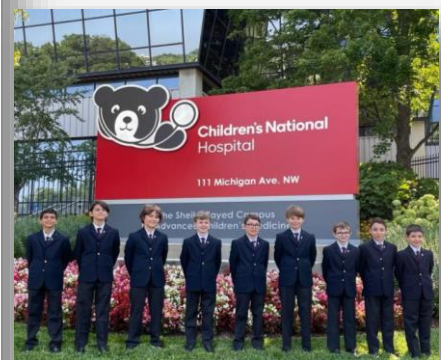
A l'extérieur du Children's National Hospital Washington, D.C.