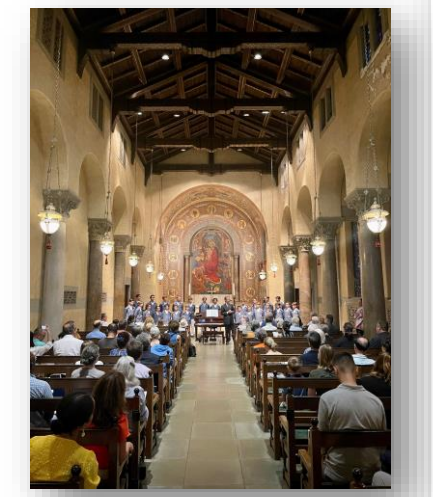
L'Eglise St. Barts, New York