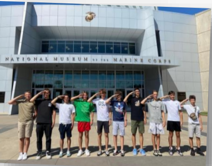
Au Musée national du Marine Corps