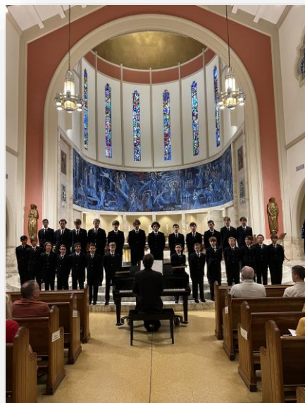
Cathédrale St, Mary, Miami FL