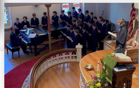
A l'église méthodiste unie de Savannah, GA