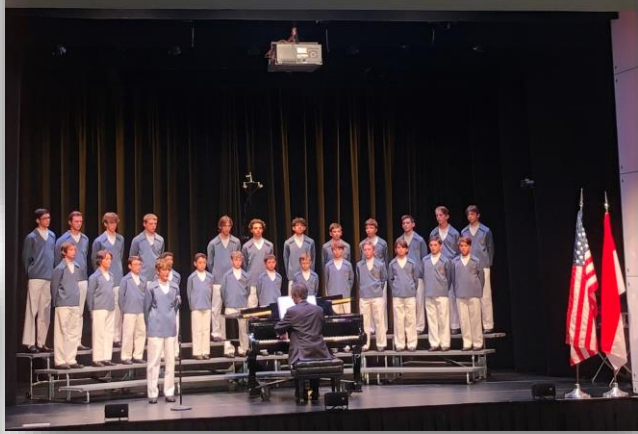
Sur la Scène du Millénaire, Center Kennedy