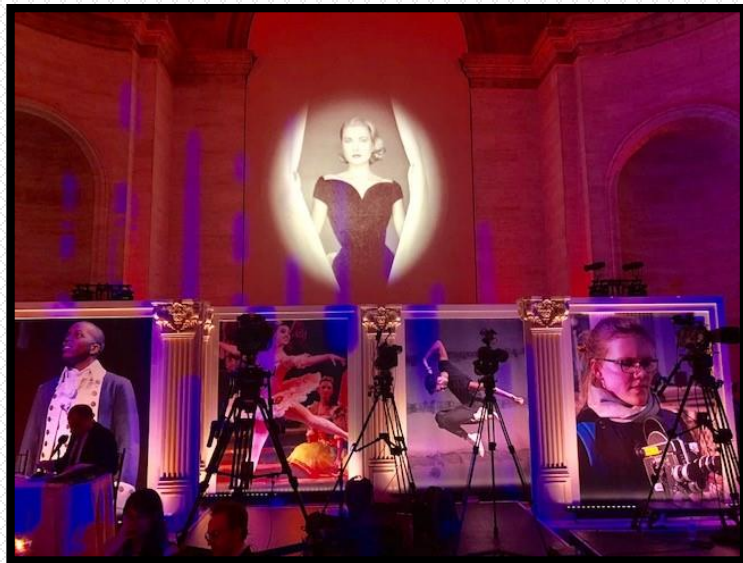
Une exposition du gala au Cipriani 25 Broadway à New York

La remise des prix de la fondation Princess Grace - USA par S.A.S. la Princesse Charlène de Monaco, le 16 octobre à New York, lors d'un grand dîner de Gala animé par l'actrice Bebe Neuwirth. Trente-cinq artistes étaient récompensés avec à l'honneur Tim Daly, acteur primé, metteur en scène, réalisateur et philanthrope qui a reçu le prestigieux Prix Prince Rainier III ; Sam Gold, metteur en scène lauréat du Prix Tony et Kyle Abraham, fondateur de la troupe de danse A.I.M. ( Abraham in Motion ) récipiendaires du Prix de la Statuette Princess Grace . Pour conclure la cérémonie des artistes lauréats des Prix des années précédentes ont fait la joie des invités en leur offrant une splendide performance.