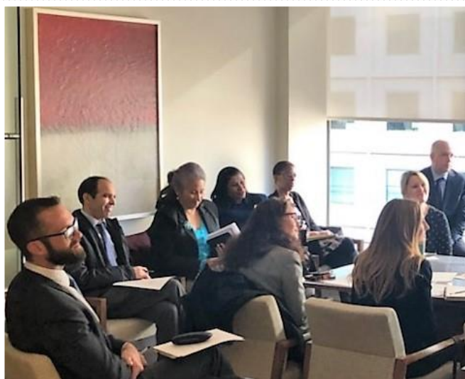
Des membres de l'USAID et de l'Armée américaine se joignent à une discussion sur Monaco

près l'Ambassade, dans un échange informel, pour évoquer l'histoire, les coutumes et les grandes orientations de la politique étrangère de la Principauté, tout particulièrement en matière de développement international. Cette visite, la deuxième de ce type organisée cette année, s'inscrit dans le cadre d'un programme annuel de cours linguistiques intensifs offerts par l'USAID et le Ministère de la Défense américain aux diplomates et fonctionnaires de l'USAID, ainsi qu'aux agents, officiers, et sous-officiers de l'Armée américaine chargés des affaires civiles. Le groupe était composé de fonctionnaires et de militaires américains qui suivent des cours de français à l'Institut américain des Relations extérieures et au Defense Language Institute , et qui seront déployés ou affectés auprès de l'AFRICOM (Commandement militaire américain pour l'Afrique) et de l'EUCOM (Commandement militaire américain en Europe).