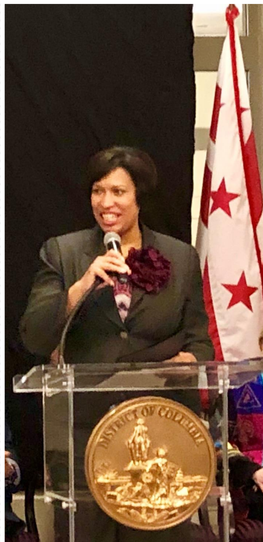
La Maire de Washington, Muriel Bowser

Lors de la réception Mme Bowser a également précisé « C'est ainsi que mon administration a participé à plusieurs missions à l'étranger afin de mieux faire connaître les opportunités économiques qu'offre Washington aux investisseurs étrangers et, encourager les représentations étrangères à organiser des réceptions à l'occasion de la Conférence des Maires américains laquelle se tient annuellement au mois de janvier, à Washington. Ces rencontres permettent aux diplomates en poste d'établir des contacts avec de hauts responsables des administrations locales américaines, en vue d'éventuels échanges économiques et culturels bilatéraux ».