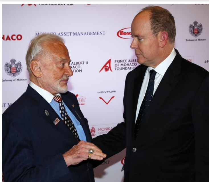
D g à d: Buzz Aldrin, S.A.S Prince Albert II