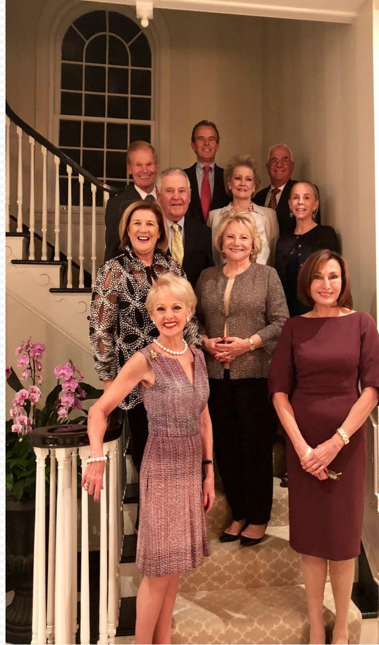
Dîner du National Museum of Women in the Arts (NMWA)

Le National Museum for Women in the Arts, constitué en 1981, est le seul grand musée du monde consacré à la promotion des réalisations des femmes dans les domaines du visuel, du spectacle et de la littérature. Depuis son ouverture, en 1987, à Washington, le musée a acquis une collection de plus de 4.500 œuvres d'art - peintures, sculptures, œuvres sur papier et art décoratif.