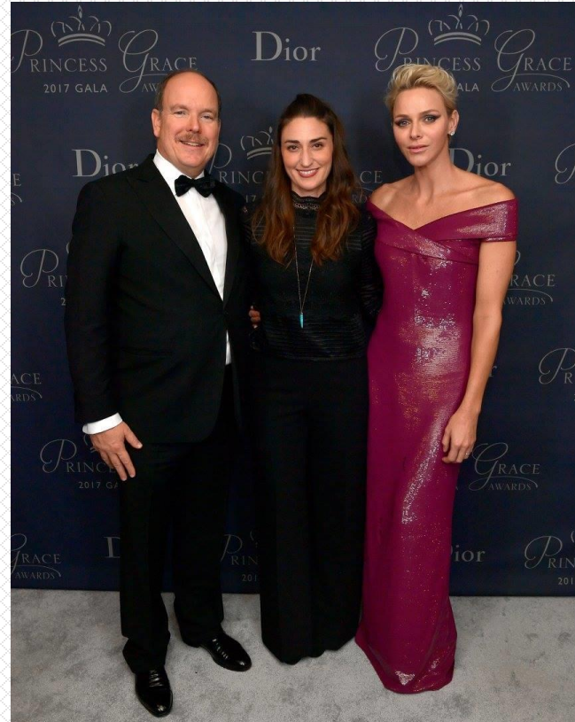
La chanteuse Sara Bareilles entourée de LL.AA.SS.