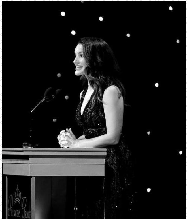
La soirée a été animée par l'actrice Kristin Davis