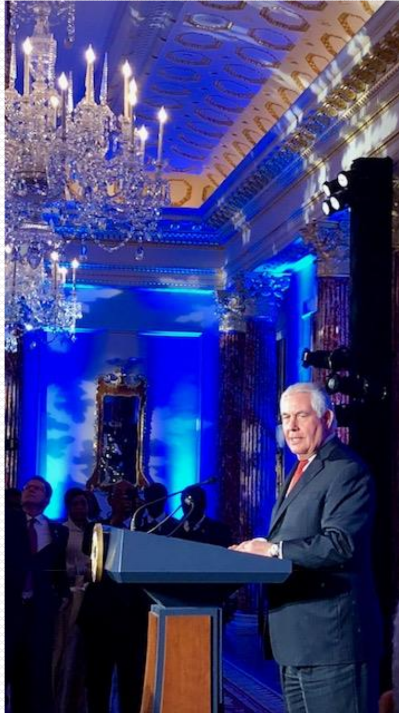
L'Honorable Rex Tillerson, Secrétaire d'Etat américain

Dans son discours, le Secrétaire d'Etat a évoqué son vif désir de renforcer les rapports chaleureux qui existent entre son Ministère et les Missions diplomatiques présentes dans la Capitale américaine.