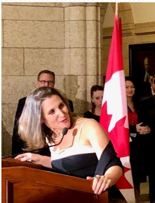
L'Honorable Chrystia Freeland, Ministre des Affaires Mondiales Canada