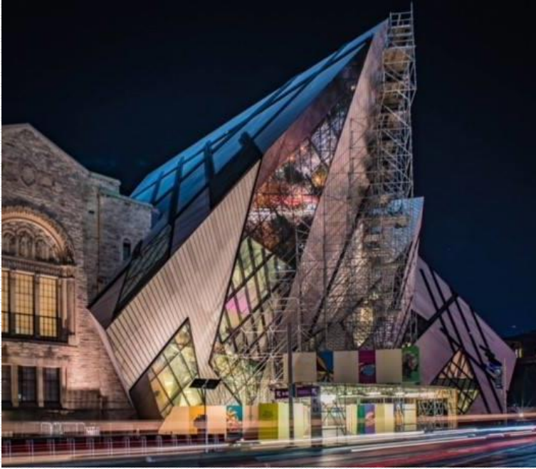
Musée Royal de l'Ontario

Plus tôt dans la journée, le symposium intitulé “The Changing Face of the Arctic” a permis aux lauréats 2017 de présenter leurs recherches à l’audience. Dans son intervention, S.E Madame l’Ambassadeur a rappelé qu’il y a plus d’un siècle, l’aïeul du Prince Albert II, le Prince Albert Ier, a été l’un des pionniers de l’océanographie moderne et fondateur du Musée océanographique de Monaco. L’intervention a été suivie de la projection d’une vidéo présentant la Fondation Albert II de Monaco.