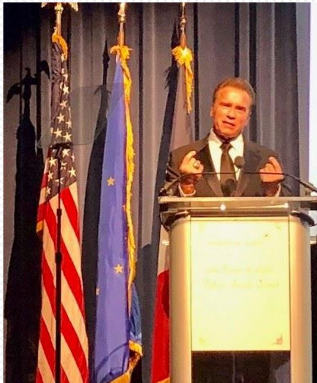
Arnold Schwarzenegger, ancien Gouverneur de la Californie, lors de son discours.

La Fondation à but non lucratif "Points of Light", qui est aujourd'hui la plus grande organisation du monde consacrée au service de bénévolat, a été créée en 1990 par l'ancien Président américain G.W. H. Bush afin de promouvoir l'esprit de volontariat dans le monde. Le Prix, nommé "Daily Points of Light Award", récompense, tous les ans, les actions volontaires de simples citoyens américains engagés à résoudre les problèmes sociaux dans leurs communautés.