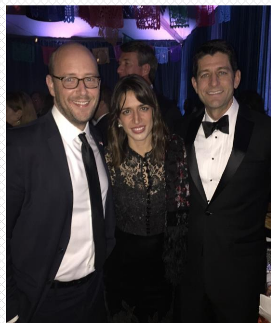
Les invités lors du dîner à la Résidence de l'Ambassadeur de Monaco