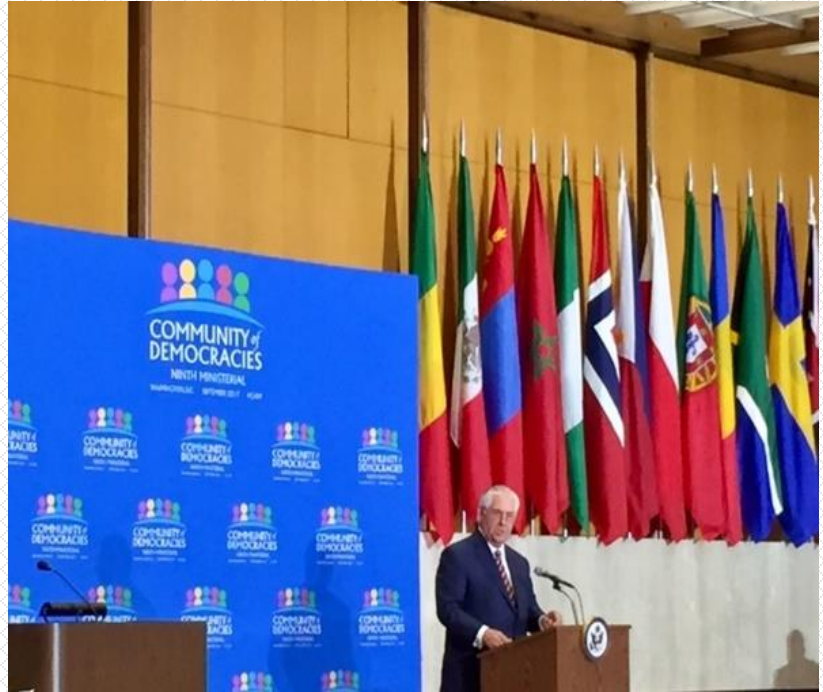
L'Honorable Rex Tillerson, Secrétaire d'État, donne son discours lors du 9e Conseil d'administration ministériel de la Communauté des démocraties

La Communauté des démocraties, créée en 2000, est une organisation intergouvernementale de pays démocratiques ou en transition démocratique ayant pour but commun de renforcer et de promouvoir la démocratie et sa mise en application à travers le monde. Ses normes énoncées dans la Déclaration de Varsovie vers une Communauté de démocraties ont été signées par 106 pays.