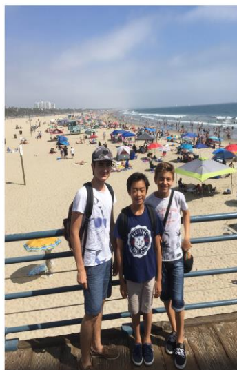
Tourné des Petits Chanteurs de Monaco Canada et Etats-Unis juillet 2017