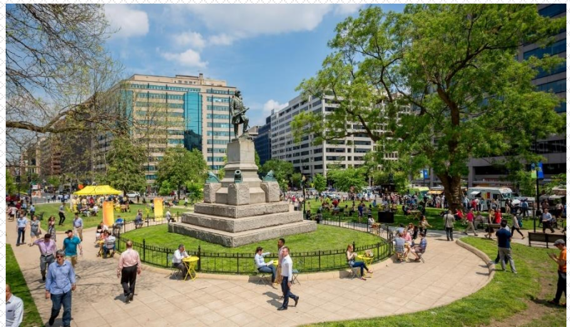
Farragut Square, Washington D.C.