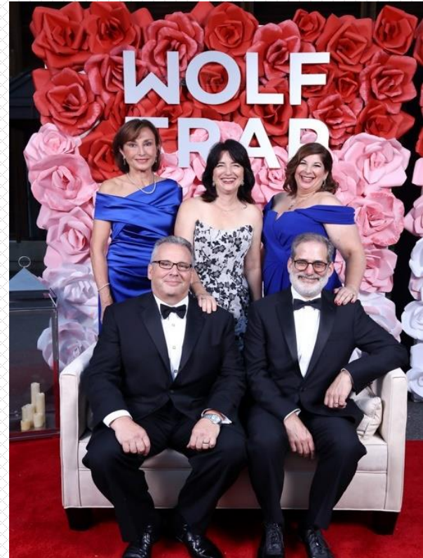
L'Ambassadeur avec les sponsors de la soirée