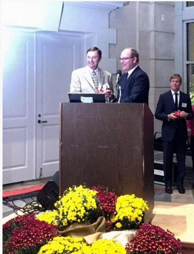
S.A.S. le Prince Souverain reçoit le Prix du Stroud Centre

Le Stroud Centre se donne pour mission d'étudier les ruisseaux et les rivières de manière à assurer la préservation des voies d'eau navigables et la restauration des voies d'eau polluées. Les scientifiques du Stroud Center ont déjà testé à cette fin plus de 2.000 rivières et ruisseaux dans le monde.