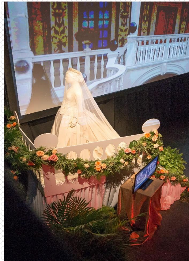
Reproduction de la robe de mariée de S.A.S. la Princesse Grace