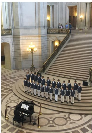
Mairie de San Francisco