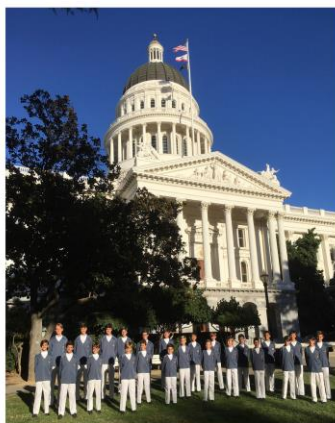
California State Capitol