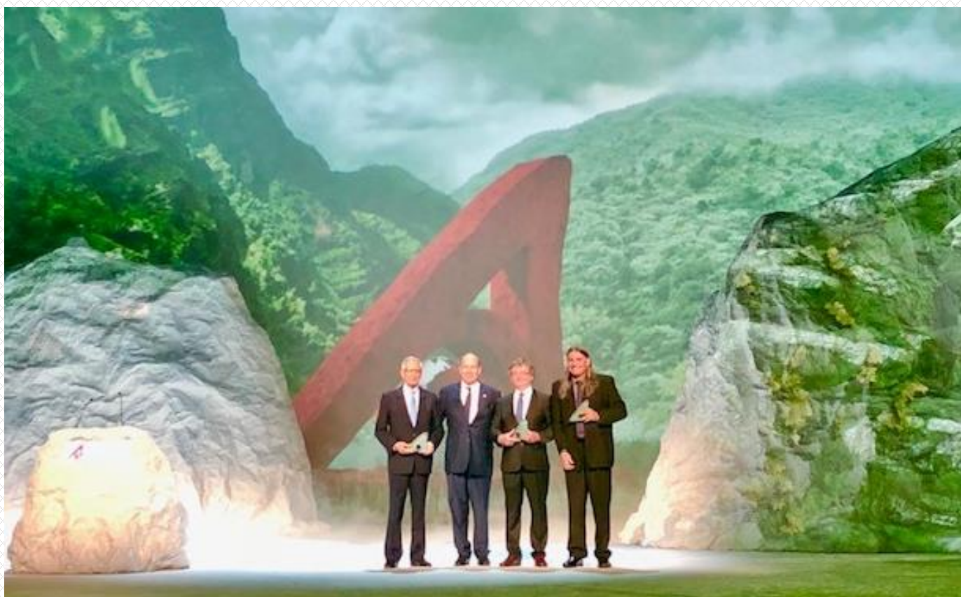
S.A.S. le Prince Souverain avec les Lauréats de la FPA2 2018