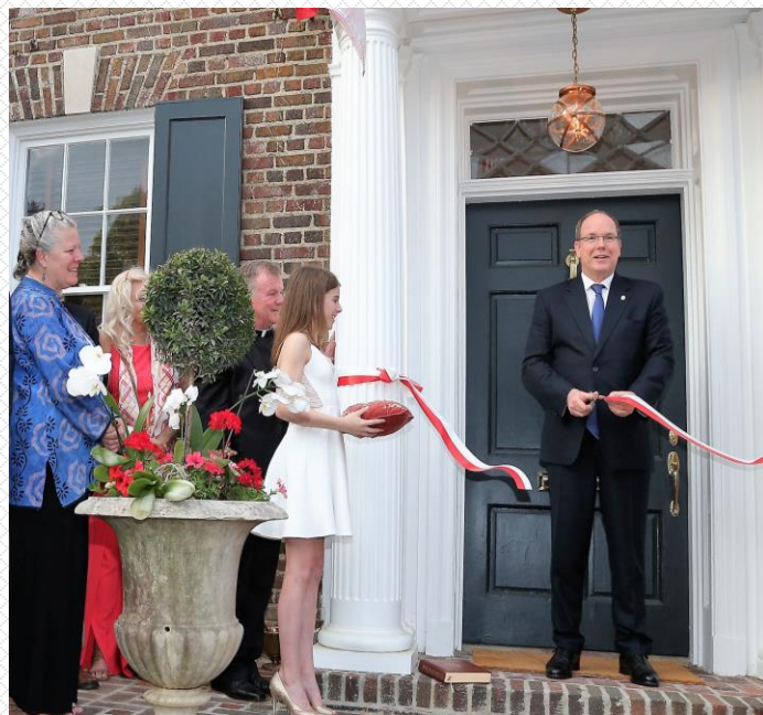
S.A.S. Prince Albert II de Monaco inaugure la maison des Kelly