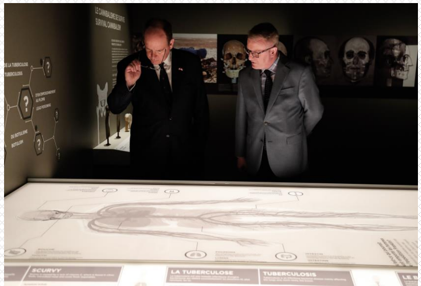
S.A.S. le Prince Souverain au Musée canadien de l'histoire

Le Prince Souverain et Sa délégation ont ensuite visité l'exposition " Périr dans les glaces: le mystère de l'expédition Franklin " au Musée canadien de l'histoire. À son retour à la Colline Parlementaire, le Prince a échangé avec le Président du Sénat puis le Président de la Chambre des Communes canadiens avant de conclure Sa visite. Dans la soirée, la délégation monégasque a participé au dîner offert par Mme Julie Payette, Gouverneur général du Canada, en commémoration des 10 ans de relations diplomatiques entre les deux pays.