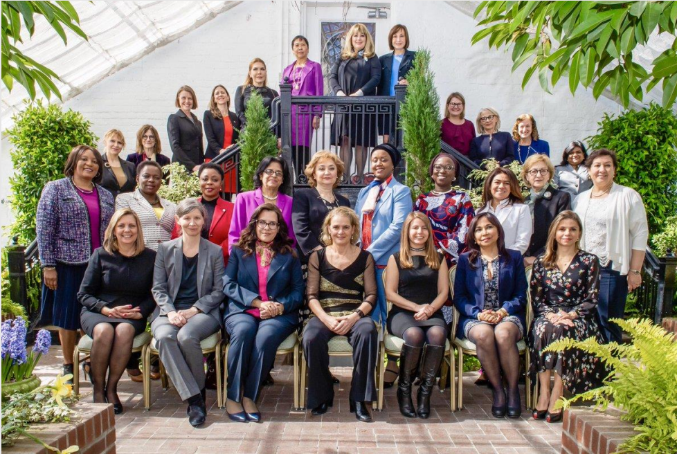
Au centre, première rangée, S.E. la très honorable Julie Payette, gouverneure générale du Canada, entourée des femmes Chefs de mission au Canada