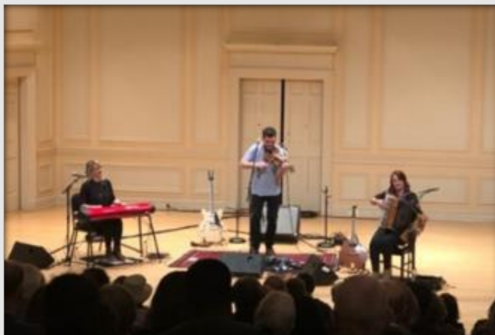
VISHTÈN chez Coolidge Auditorium , Thomas Jefferson Building Library of Congress