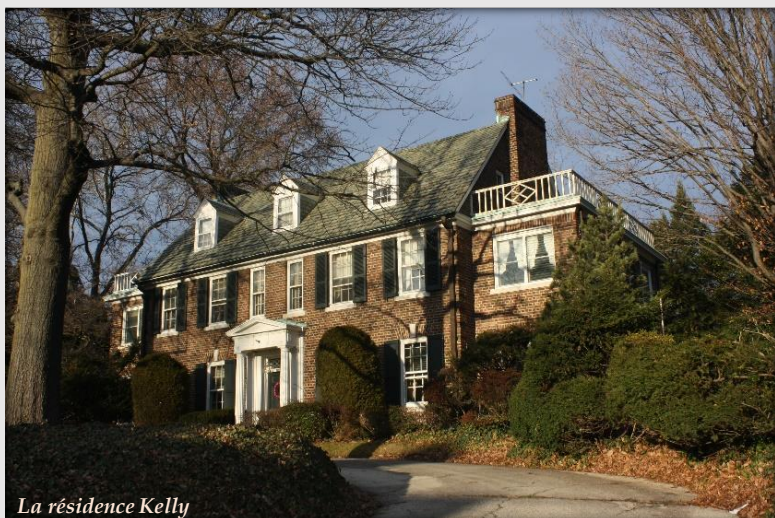
La résidence Kelly

Ces nouveaux locaux de Philadelphie (Pennsylvanie) occupent la très belle résidence de la famille Kelly, le lieu d'enfance de la Princesse Grace, qui a été rachetée en 2017 par S.A.S. le Prince Albert II de Monaco.