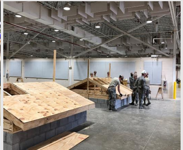
Naval Construction Battalion Center

Le Département d'État américain a organisé, du 24 au 26 février, un voyage dans le Mississippi (État du Sud des États-Unis), dans le cadre de son programme « Experience America ».