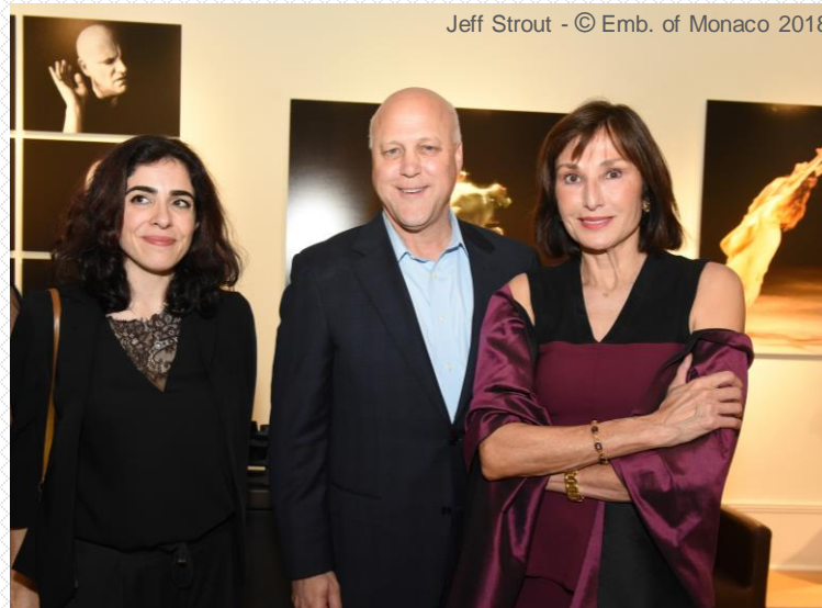
Jeff Strout - © Emb. of Monaco 2018