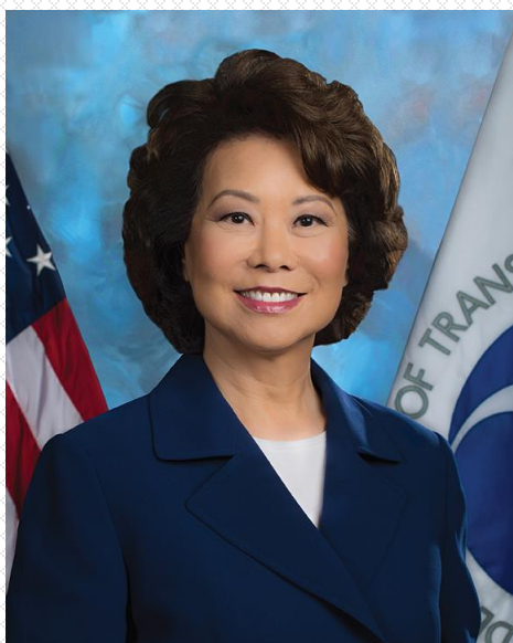
L'Honorable Elaine Chao, Ministre des Transports des Etats-Unis